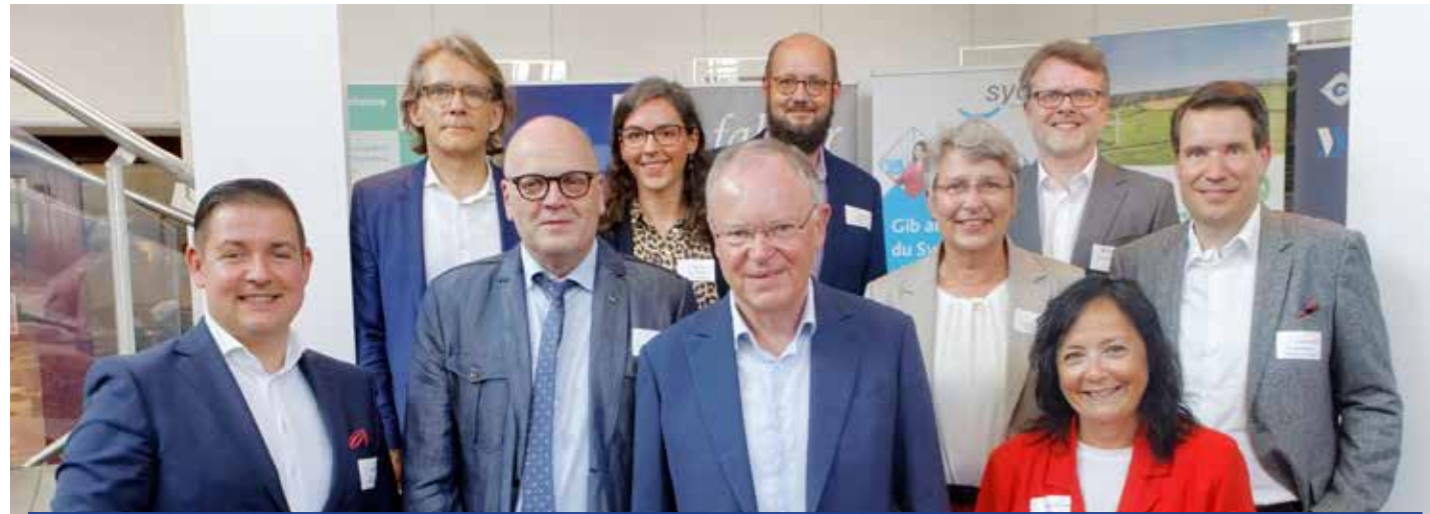
Stellten im Rahmen der 20-Jahrfeier gemeinsam die Pläne für das Life Science Valley Niedersachsen vor

20 Jahre SüdniedersachsenStiftung: Große Jubiläumsfeier in der Stadthalle Northeim