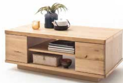
2 | Couchtisch