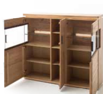
4 | Highboard