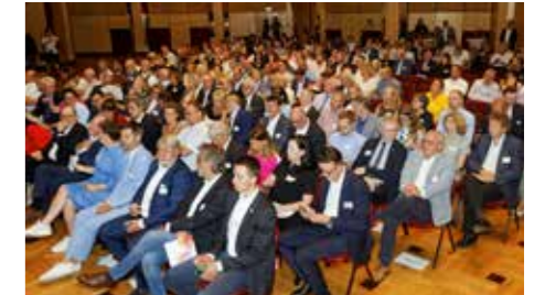
Rund 220 Gäste waren der Einladung der SüdniedersachsenStiftung in die Stadthalle Northeim gefolgt.