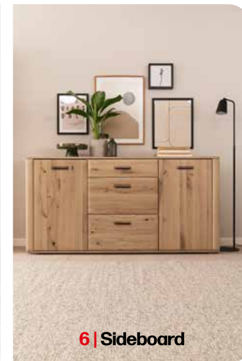
6 | Sideboard