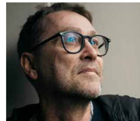
Jan Weiler Göttinger Literaturherbst