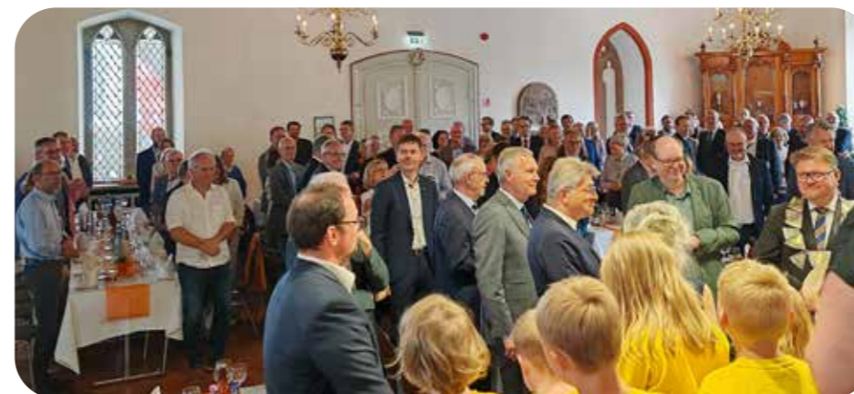
Zahlreiche Gäste kommen zum Empfang im Duderstädter Rathaus