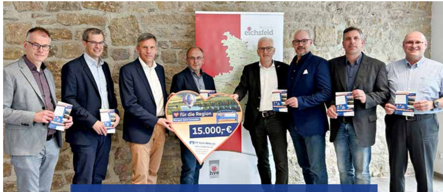
Startschuss Eichsfelder Schulpreis.

Projekt zur Förderung von regionalem Wissen