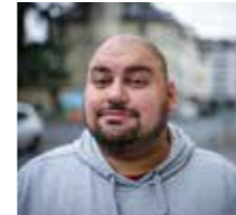
BORA