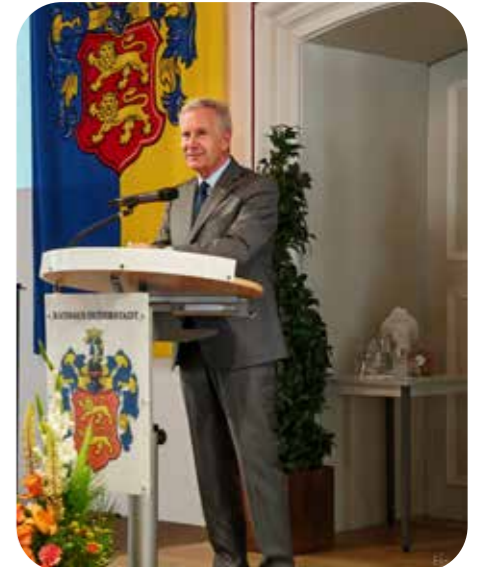
Bundespräsident a.D. Christian Wulff