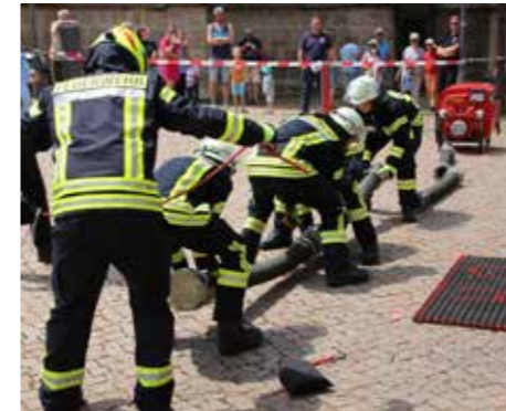
Leistungsvergleich in Duderstadt.