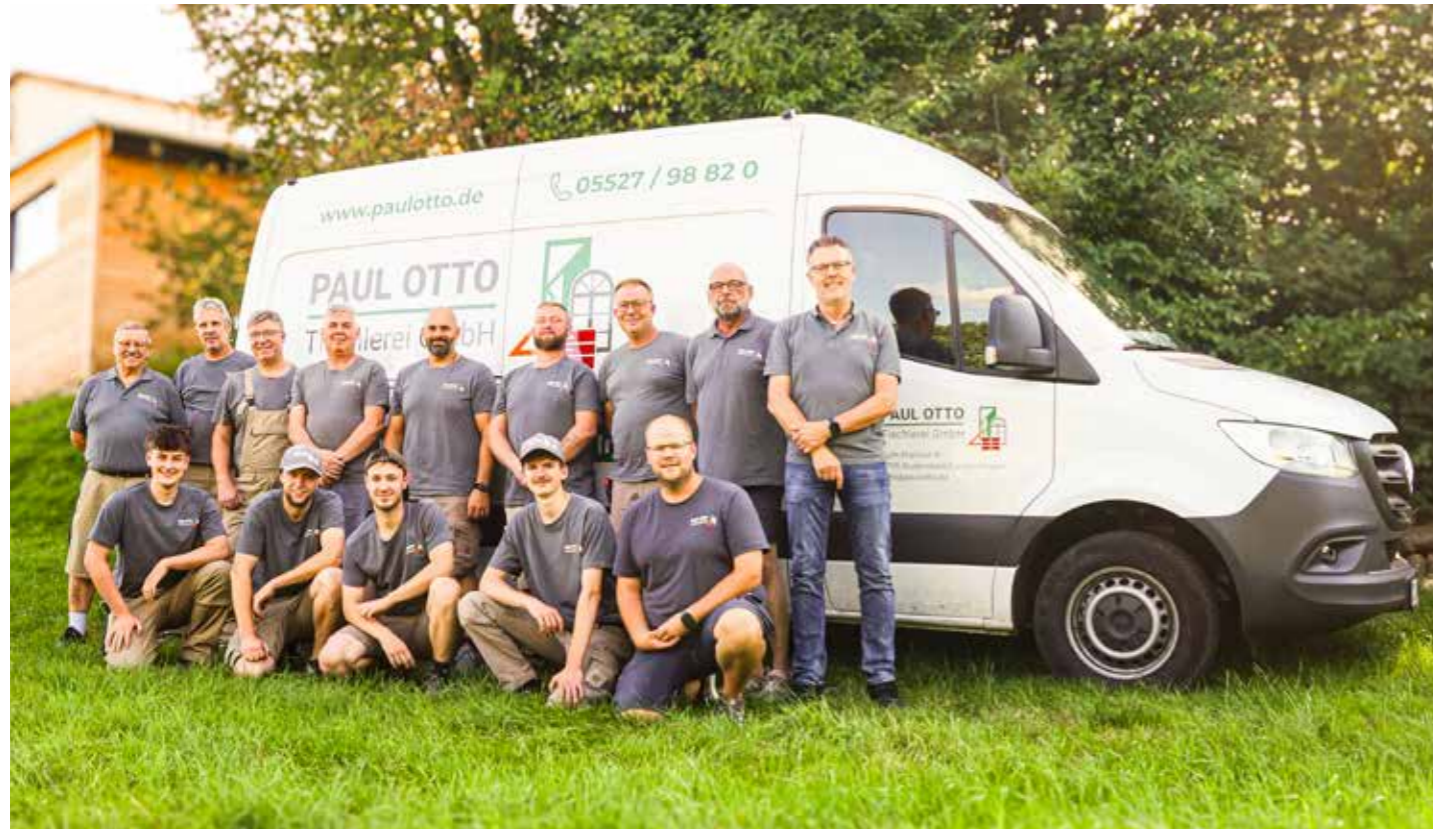
Bereits früh morgens für Sie auf den Beinen: Das Team der Paul Otto Tischlerei in Langenhagen.

Möbel, Küchen, Treppen, Fenster oder Spezialanfertigungen - die Paul Otto Tischlerei in Langenhagen steht für Handwerk „at his best“