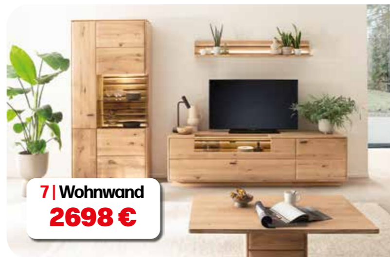
7 | Wohnwand 2698 €