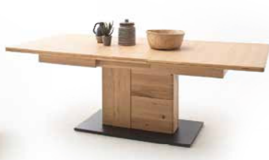
3 | Esstisch