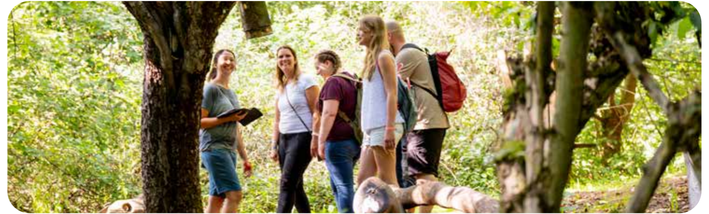
Kombinationstalente sind gefragt beim Outdoor Escape Game.

In der Hofremise informiert die Ausstellung „Natur bewahren“ über die Hintergründe und Zusammenhänge der Biodiversität – auch anhand von Beispielen vor Ort. So konnte sich am ehemaligen Todesstreifen an der innerdeutschen Grenze eine außergewöhnliche Artenvielfalt erhalten. Nach der Grenzöffnung 1989 entstand hier das Grüne Band als länderübergreifender Biotopverbund. Sielmanns Biotopverbund Eichsfeld-Werratal ist ein 130 Kilometer langes Teilstück des Grünen Bandes und vom Gut aus in wenigen Schritten