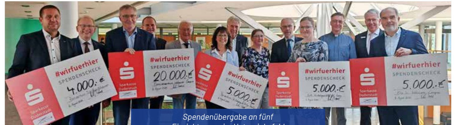
Spendenübergabe an fünf Einrichtungen im Untereichsfeld

Eine Spendensumme von insgesamt 39.000 Euro hat die Sparkassenstiftung Untereichsfeld an mehrere soziale Einrichtungen in der Region übergeben. Die Spenden stammen aus den Rücklagen des Trägervereins der Familienbildungsstätte Untereichsfeld e.V. (Fabi). Nach dessen Auflösung im Jahr 2022 wurde das Restvermögen zur Unterstützung der sozialen Einrichtungen bestimmt, damit die inhaltliche Arbeit der Fabi weiterhin Bestand habe. Die Übergabe der Spendenschecks fand während einer Feierstunde in den Räumen der Sparkasse Duderstadt statt.