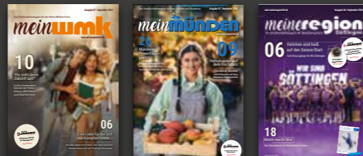
Bild- und Textnachweis – soweit nicht anders angegeben – Mundus Marketing & Interactive GmbH, Adobe Stock, Shutterstock, Fotolia, Pixabay, bei Gewinnspielen ist der Rechtsweg ausgeschlossen.