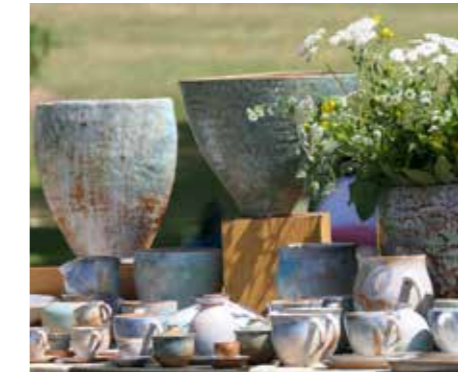
Kunsthandwerk auf Gut Herbigshagen

Kulturveranstaltungen beim Deutschen Wandertag Der Deutsche Wandertag 2024 findet im Eichsfeld statt. Doch es wird nicht nur gewandert. Zahlreiche Kulturveranstaltungen präsentieren die Region auf vielfältige Weise. Angeboten werden Museumsführungen, Märkte, Städtetouren, Musik und Kunst, Vorträge, Dorffeste und vieles mehr. Das komplette Programm gibt es bei www.dwt2024.de .