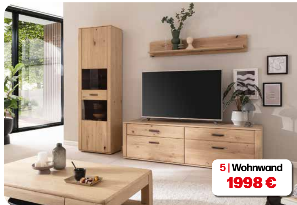
5 | Wohnwand 1998 €