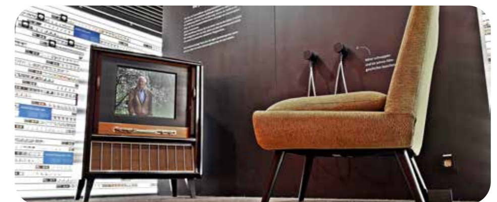
Ein Leben für den Film – Einblicke ins Sielmann-Archiv

Weitere Infos bei www.sielmann-stiftung.de