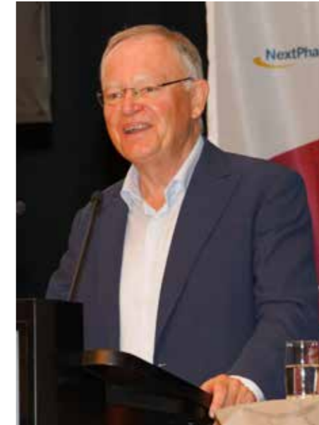
Niedersachsens Ministerpräsident Stephan Weil hielt die Festrede.