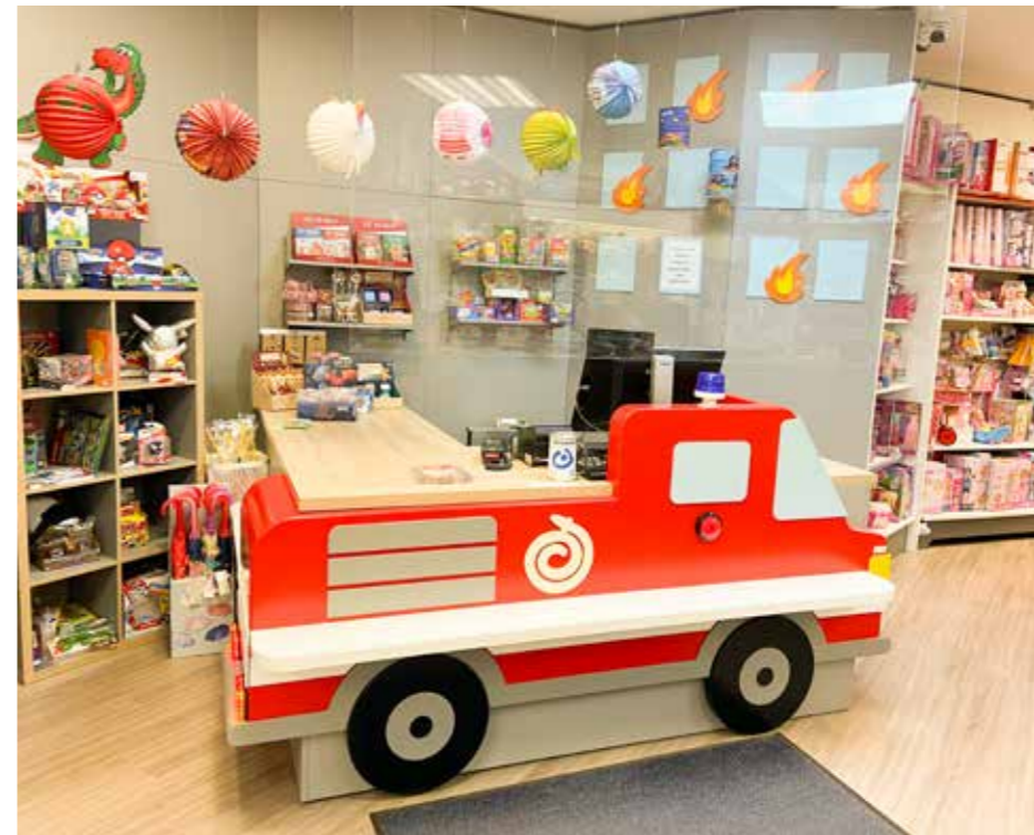
Individuell geplante Möbel aus der Hand des Fachmanns.

„Wir haben uns als komplette Tischlerei im Markt positioniert. Dabei bieten wir