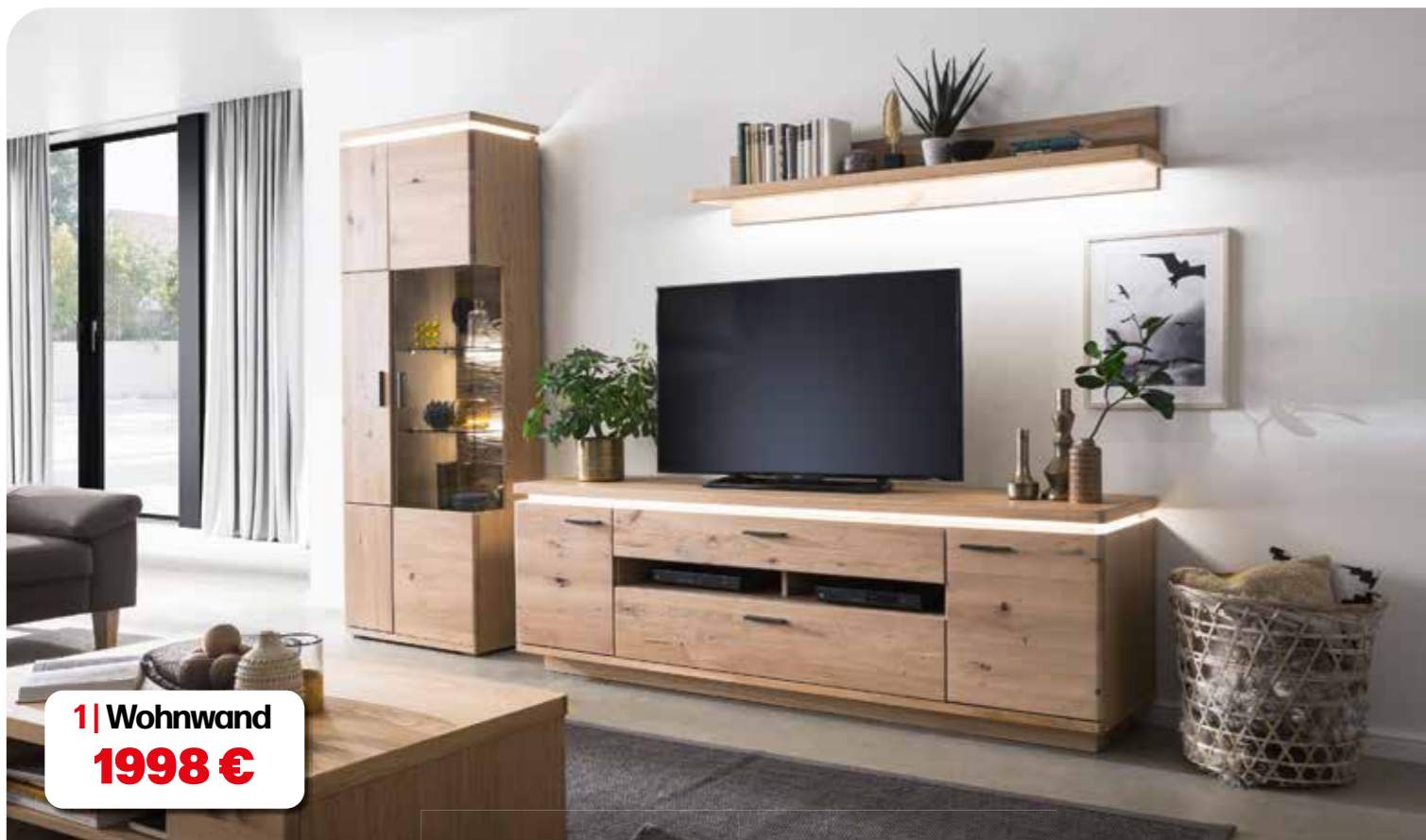
1 | Wohnwand 1998 €