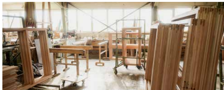
Blick in die Werkstatt der Paul Otto Tischlerei.

In der 1980 neu gebauten Produktionshalle werden bis heute Fenster in sämtlichen Holzarten, Holz-Alu und Pfosten-Riegelfassaden sowie Haustüren eigens hergestellt. Zusätzlich fertigt die Eichsfelder Tischlerei sämtliche Möbel, Küchen, Türen, Treppen, Kindergarten- und Praxiseinrichtungen.