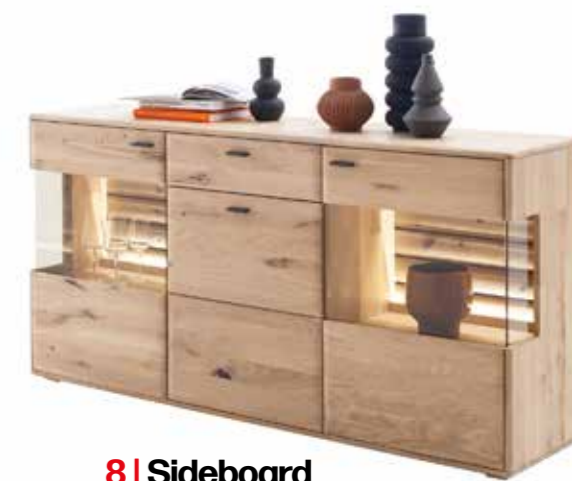
8 | Sideboard

1 | Wohnwand Front Balkeneiche bianco massiv, Korpus Eiche bianco furniert, BxHxT ca. 300x204x50cm, inkl. Beleuchtung