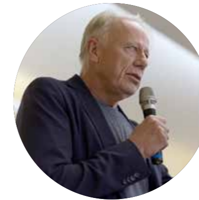
Jürgen Trittin wurde von den Göttinger Grünen feierlich verabschiedet.