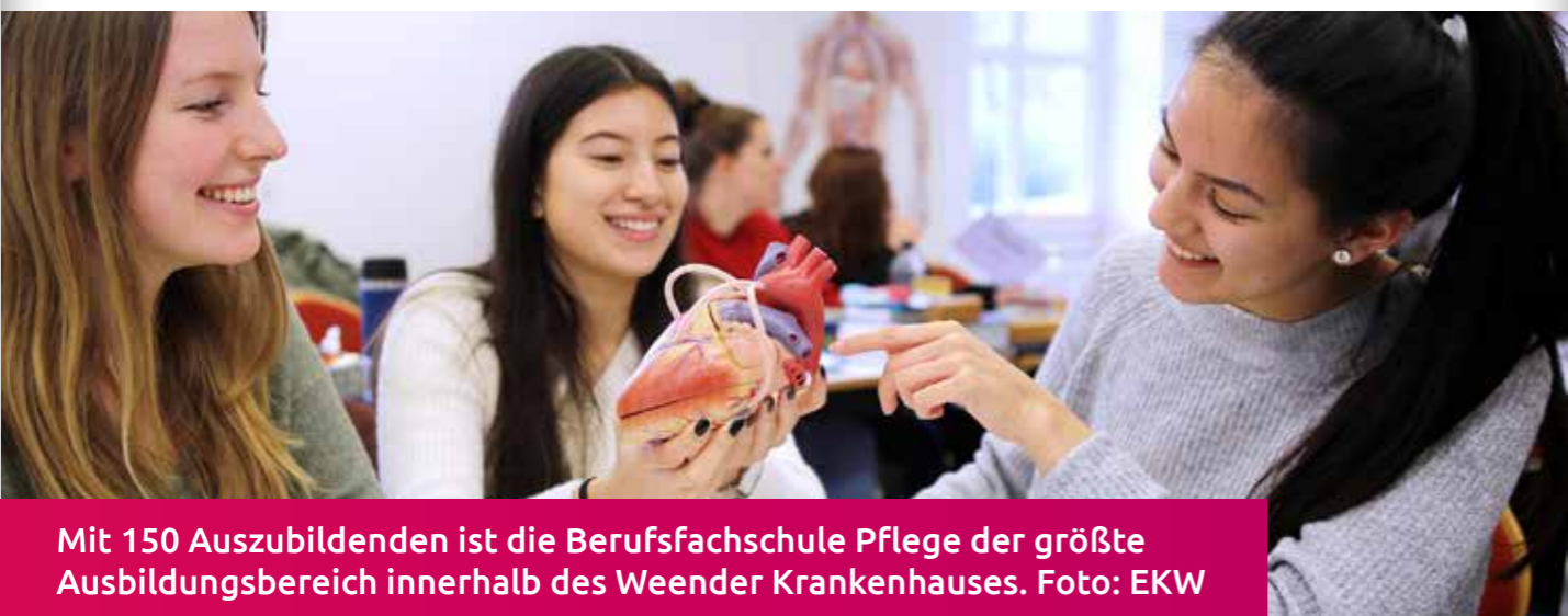
Mit 150 Auszubildenden ist die Berufsfachschule Pflege der größte Ausbildungsbereich innerhalb des Weender Krankenhauses.

🏥 Krankenhaus Weende zählt zu Deutschlands besten Ausbildungsbetrieben 🏆