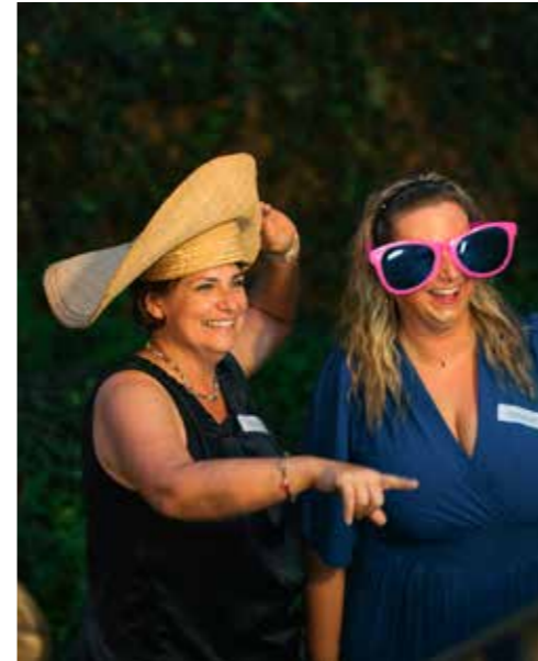
Cooler Outfits an einem heißen Sommertag.