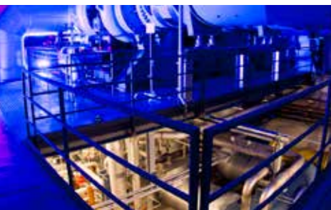
Im Turbinenprüfstand Next Generation Turbine Test Facility (NG-Turb) des DLR-Instituts für Antriebstechnik in Göttingen werden zukünftige Hochleistungsturbinen untersucht

Für diese sind mittlerweile Wärmetauscher am Prüfstand installiert, wodurch die Temperatur der Kühlluft abgesenkt und damit eine weitere Kenngröße, das Temperaturverhältnis zwischen Hauptströmung und Kühlluft, realitätsnah eingestellt werden kann. (dlr / red)