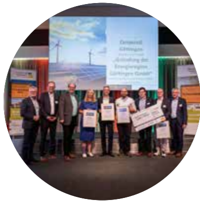
Die VertreterInnen der ERG-Gesellschafter freuen sich über die gemeinsame Auszeichnung.

In dem Gemeinschaftsprojekt arbeiten die Stadt Göttingen, der Landkreis Göttingen, die EAM Natur Energie und die Stadtwerke Göttingen zusammen, um die regionale Energieversorgung in Stadt und Landkreis Göttingen auf regenerative Energiequellen umzustellen. Oberstes Ziel ist es dabei,