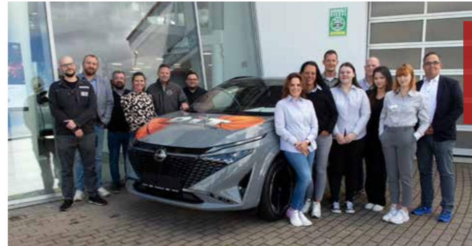
Die Mannschaft des Autohauses DiT Göttingen feierte gemeinsam mit Stammkunden und Gästen den Toyota Teamday.

Die Versuche fanden im europaweit einmaligen Turbinenprüfstand NG-Turb (Next Generation Turbine Test Facility) am DLR in Göttingen statt. Mit diesem Prüfstand werden Untersuchungen durchgeführt, bei denen die Bedingun-