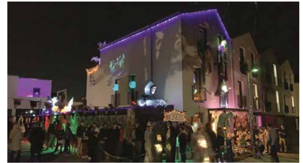
Das Horror-Haus in Göttingen-Weende lockt zu Halloween alljährlich hunderte große und kleine Besucher an.

Da das Weender Gruselkabinett von Jahr zu Jahr anwuchs, führt das Labyrinth mittlerweile im Garten beginnend quer durch den Carport bis zur Straße. „Die