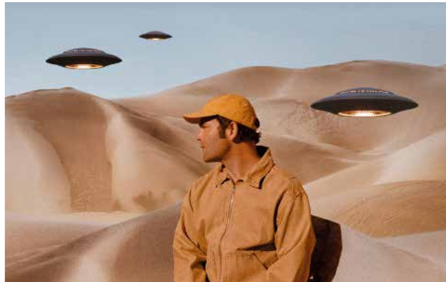
Bosse ist der erste vermeldete Top-Act auf dem NDR2 Springside-Festival in der Lokhalle.

Anfang Oktober erschien sein erstes eng-