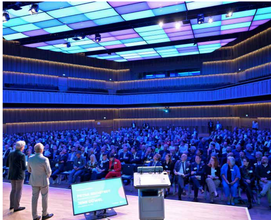
Volle Stadthalle zum Wirtschaftsempfang der UMG.