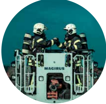
Das Praktikum: Lange Zeit verteu- felt und der Inbegriff des Kaffee-

Einmal bitte Luft anhalten: Wir könnten jetzt eine Wette abschließen, dass du folgenden Satz schon viel zu oft gehört hast. „Mach doch mal ein Praktikum!“ Viel gehört - und doch nie ans Herz gewachsen.