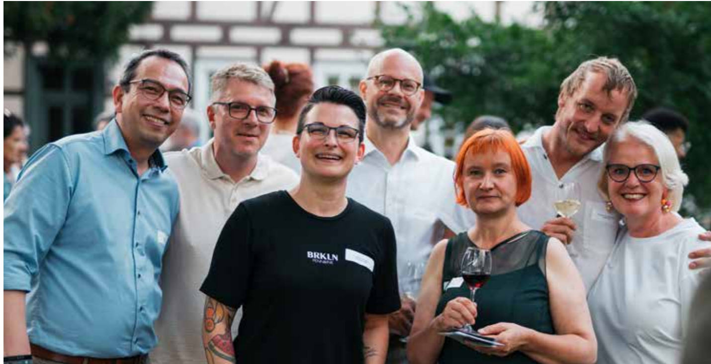
Der Vorstand der Interessenvertretung der Göttinger Innenstadt Pro City e.V..

Es war ein sommerlicher Abend im schönen Stadtgarten der Akademie der Wissenschaften. Es gab guten Wein und leckeres Fingerfood vom „Apex - made by Jaqueline“. Natürlich waren viele nette Gäste gekommen,