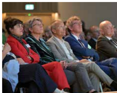
Volle Konzentration in der ersten Reihe.

Wirtschaftskontext eine Rolle spielen. Demnach haben rund ein Drittel aller Befragten schon einmal rechtsextreme Verhaltensweisen am Arbeitsplatz erleben müssen. Die Studie kommt zu dem Ergebnis, dass sich solche Einstellungen auf das Betriebsklima, auf die Zufriedenheit am Arbeitsplatz sowie auf das Kündigungsverhalten auswirken. Broistedt zog das Fazit des Abends: „Diese klare Haltung gegen rassistisches, nationalistisches, sexistisches Gedankengut und Demokratiefeindlichkeit gehört zu unseren Standortvorteilen.“ (luco / pdg)