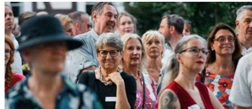
Sommerliches Fest im Garten der Göttinger Akademie der Wissenschaften.