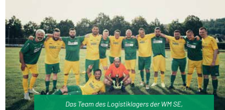
Das Team des Logistiklagers der WM SE, wie es seine Mission und Vision in die Tat umsetzt.

Die größte Besonderheit hier sind aber eindeutig unsere Kolleginnen und Kollegen. Der Zusammenhalt im Team und das Engagement der Kolleginnen und Kollegen ist bewundernswert. Gemeinsam konnten wir alle Herausforderungen in den letzten Monaten und Jahren meistern und die