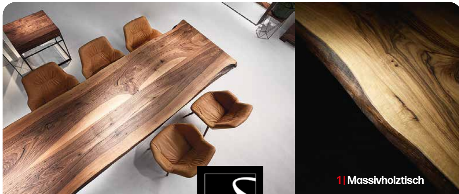
1 | Massivholztisch