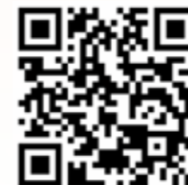
Tabalugafest im Duderstädter Kultursommer

Das komplette Programm gibt es auch bei kultursommer-duderstadt.de .