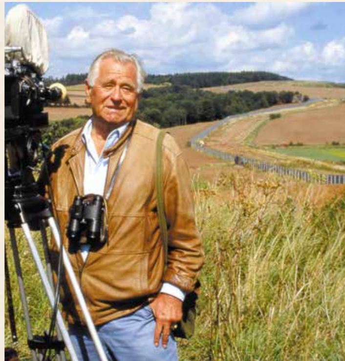
Heinz Sielmann dreht 1988 direkt am Grenzstreifen bei Duderstadt

Auf Gut Herbigshagen wird zudem das Archiv des Naturfilmers Heinz Sielmann bewahrt. Viele seiner Werke sind in multimedialen Ausstellungen anzusehen. Seine Filme erhielten internationale Auszeichnungen und sind an vielen Orten der Welt entstanden, von den Galapagos-Inseln bis zum Kongo – oder am einstigen Todesstreifen an der ehemaligen innerdeutschen Grenze. Bei Duderstadt drehte Heinz Sielmann 1988, also ein Jahr vor dem Mauerfall, den Film „Tiere im Schatten der Grenze“. Hier beschrieb er bei der Erstausstrahlung 1989 – noch nicht ahnend, dass wenige Monate später die Grenze Geschichte sein würde – die Vision von einem Nationalpark entlang der Grenze von der Ostsee bis zum Thüringer Wald. Heute sind mehrere Länder am Naturschutzprojekt Grünes Band beteiligt, das aus dem einstigen Todesstreifen entstanden ist und sich über 12.500 km von Nord- nach Südeuropa erstreckt.