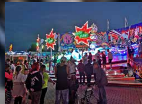
Treffen der Generationen auf dem Schützenplatz

Tickets gibt es im Vorverkauf in der Markt-Apotheke, Marktstraße 7, oder an der Abendkasse.