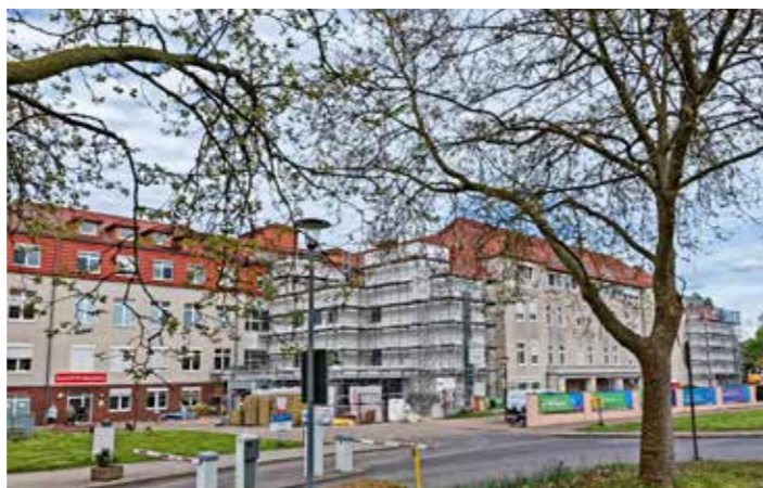
Baustelle St. Martini

Auch auf dem energetischen Sektor hat sich viel getan. Der Anteil der Biowärme, die für Prozesswärme, Warmwasser und Heizungen genutzt wird, liegt inzwischen bei ca. 85 Prozent. Der Strombedarf wird zu über 60 Prozent über ein neues Blockheizkraftwerk gedeckt.