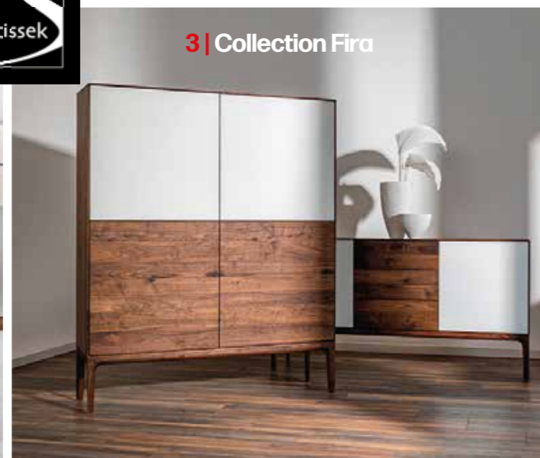
3 | Collection Fira