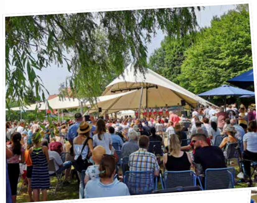
Dancing Afternoon des TV Jahn