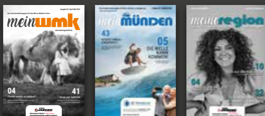
Bild- und Textnachweis – soweit nicht anders angegeben – Mundus Marketing & Interactive GmbH, Adobe Stock, Shutterstock, Fotolia, Pixabay, bei Gewinnspielen ist der Rechtsweg ausgeschlossen.