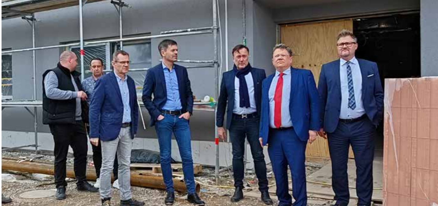
Der Niedersächsische Gesundheitsminister Philippi (2.v.r.) besichtigt den Anbau des St. Martini Krankenhauses