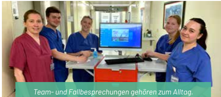
Team- und Fallbesprechungen gehören zum Alltag.