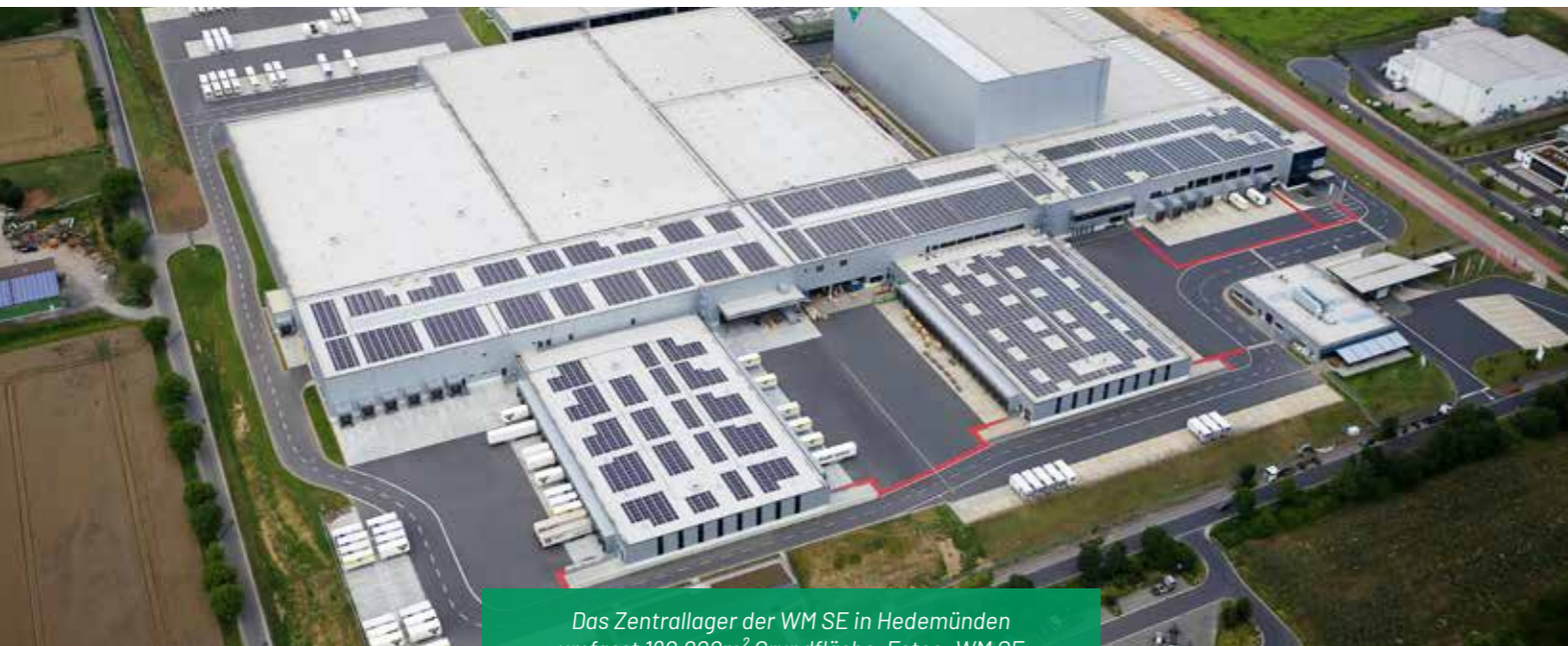
Das Zentrallager der WM SE in Hedemünden umfasst 180.000m 2 Grundfläche.

Im Herzen von Deutschland: Das WM Zentrallager in Hedemünden