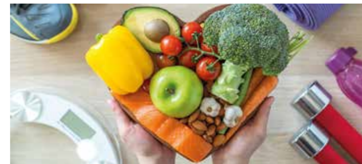
Eine ausgewogene Ernährung hilft, Herzkrankheiten vorzubeugen.

und Docosahexaensäure (DHA) helfen gleich mehrfach gegen Herz-Kreislauf-Erkrankungen. Sie wirken entzündungshemmend. Außerdem weiten sie die Gefäßwände und tragen dazu bei, erhöhte Blutfette und einen erhöhten Blutdruck zu senken. Lachs, Hering und andere fettreiche Fische sind wichtige Quellen für diese Omega-3-Fettsäuren. Für einen gezielteren Einsatz kann es ratsam sein, Omega-3-Präparate aus gereinigtem Fischöl oder Algenöl einzunehmen. (akz-o)