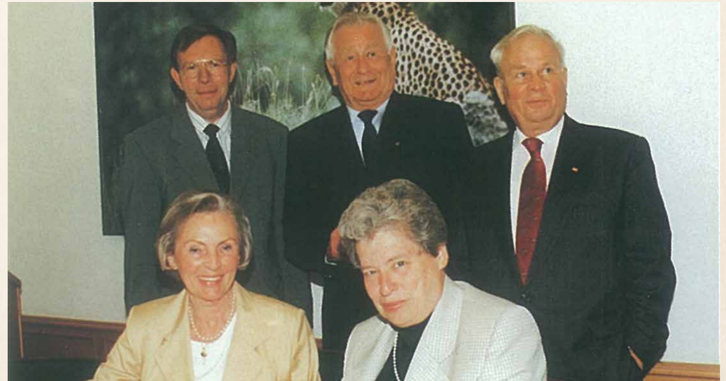
Inge und Heinz Sielmann bei der Gründung ihrer Stiftung im Berliner Zoo