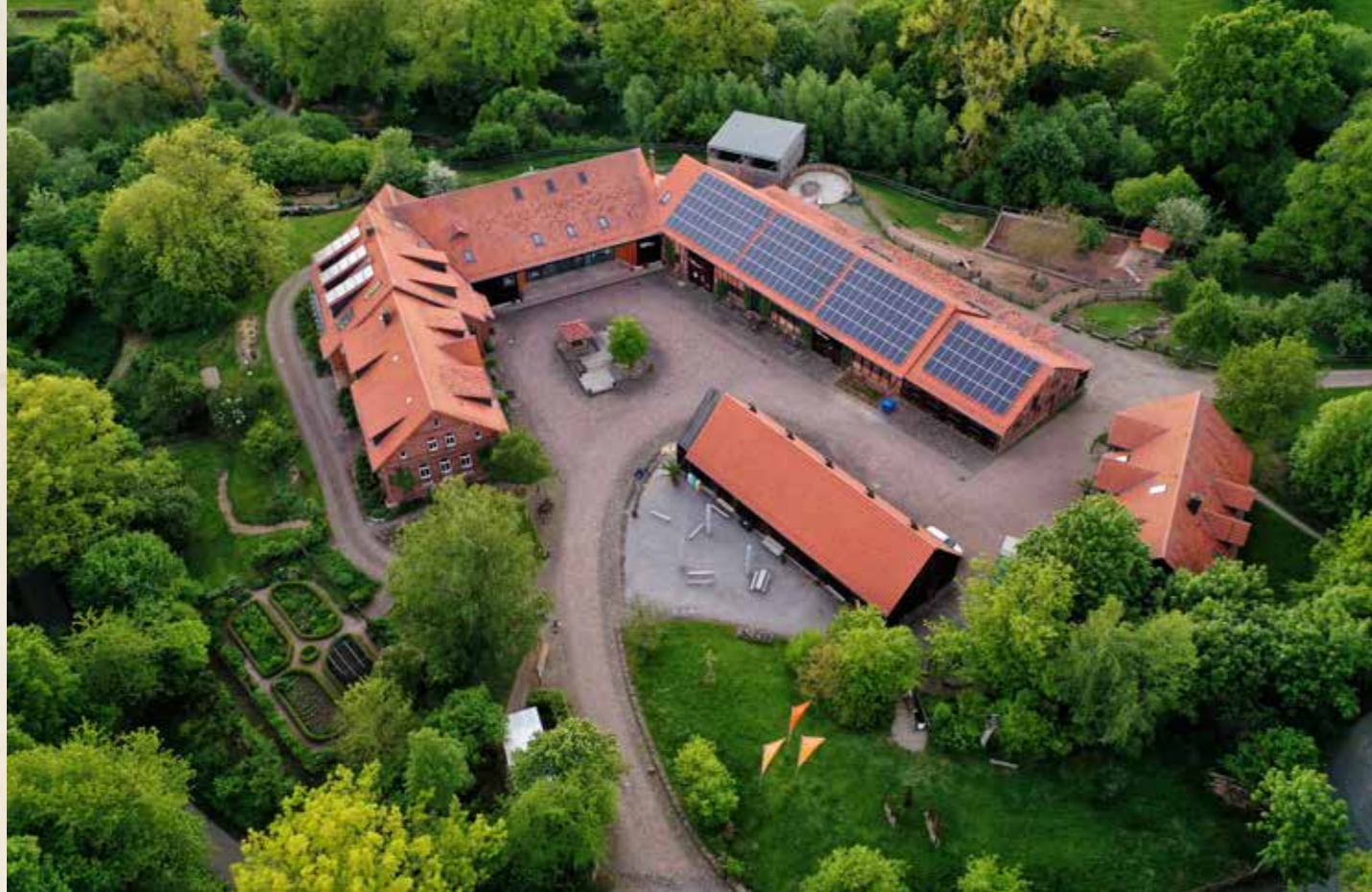
Luftansicht von Gut Herbigshagen bei Duderstadt, dem Hauptsitz der Heinz Sielmann Stiftung