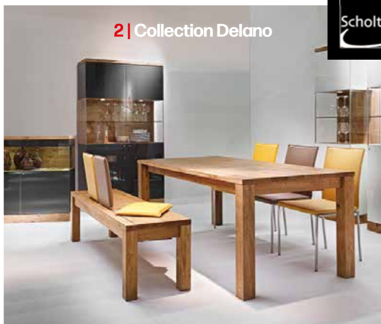
2 | Collection Delano