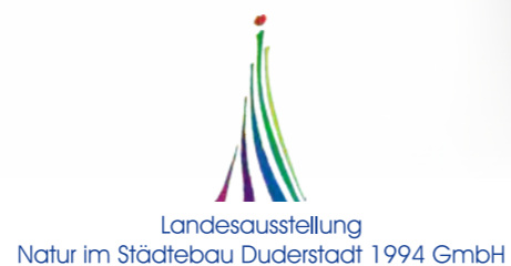
Kultursommer im LNS-Park

Zu den langjährigen Unterstützern und Sponsoren gehören die Sparkasse Duderstadt, die EEW und die Harz Energie. Eines der nächsten Highlights im Kultursommer ist das Duderstadt Open Air Festival, das am Wochenende 15./16. Juni gleich auf zwei Bühnen im LNS-Park stattfindet! (siehe nächste Seite)