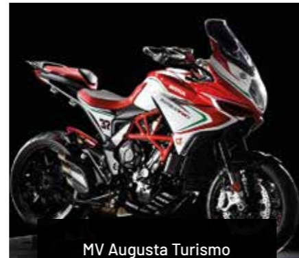
MV Augusta Turismo Veloce RC

– Mit Showroom in Hann. Münden für die Marken KTM und Husqvarna Motorcycles –