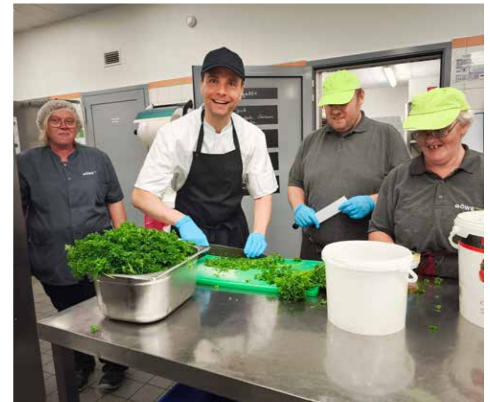
Petersilie hacken im Akkord: Dezernent Conrad Finger im Einsatz in der Großküche.

Zurzeit sind fast 1000 Menschen mit Behinderung bei GöWe beschäftigt, wohnen mit adäquater Unterstützung oder nutzen eines der vielfältigen Bildungsangebote – 400 Fachkräfte sorgen für eine individuelle Begleitung.