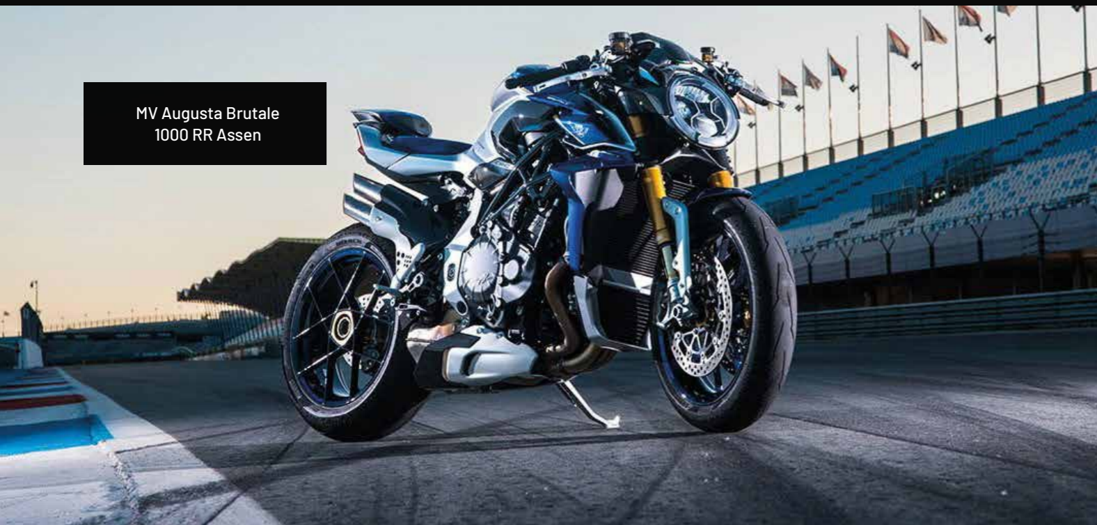
MV Augusta Brutale 1000 RR Assen