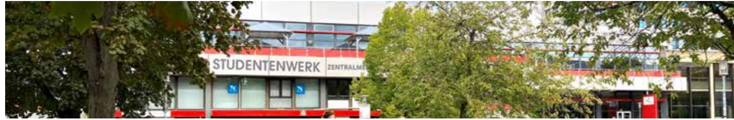
Die Göttinger Zentralmensa öffnet wieder durchgehend bis 18.00 Uhr.

Die Kürzung der Öffnungszeiten seit Sommer 2022 wird zurückgenommen