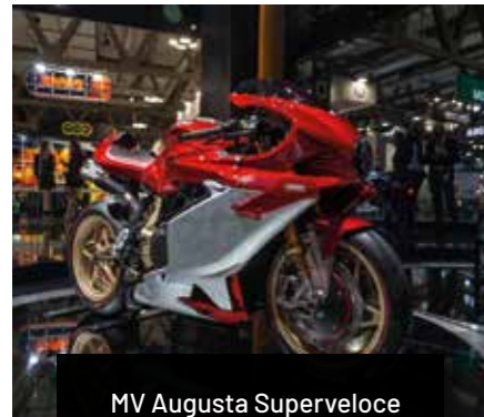
MV Augusta Superverloce 1000 Serie Oro