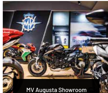
MV Augusta Showroom bald in Kassel