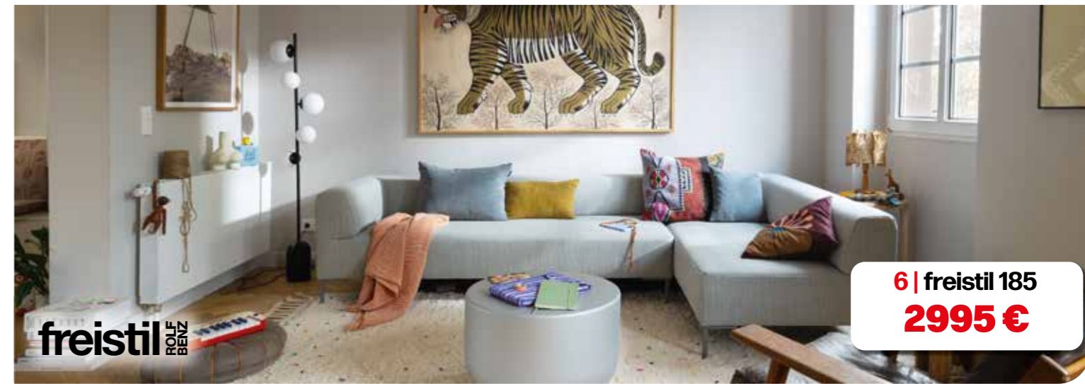
6 | freistil 185 2995 €