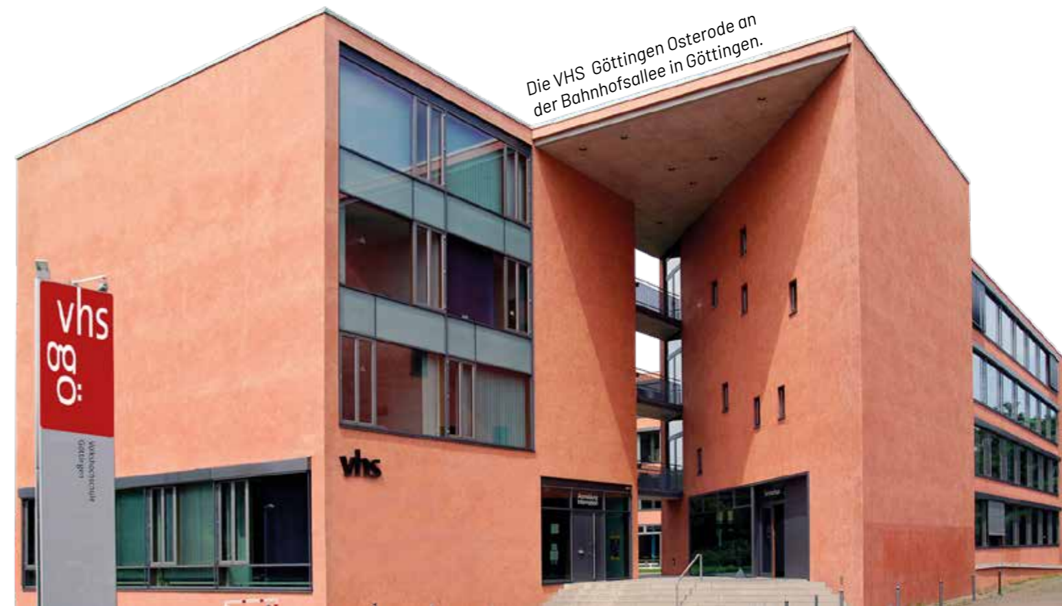
Die VHS Göttingen Osterode an der Bahnhofsallee in Göttingen.

Derzeit einzig ungelöst ist die Weiterführung der Künstlerateliers und Malkurse (Öl und Acryl), für die noch ein geeignetes Quartier gesucht wird, das natürlich kostengünstig sein muss. Hinweise, wo diese VHS-Kurse mit Staffeleien, Trockenregalen und Wasseranschluss unterschlüpfen könnten, sind sehr willkommen. „Auch das werden wir noch irgendwie lösen“, ist Müller sicher, „und dann freuen wir uns, wenn sich an allen unseren Standorten rund um die Uhr die Menschen begegnen“.